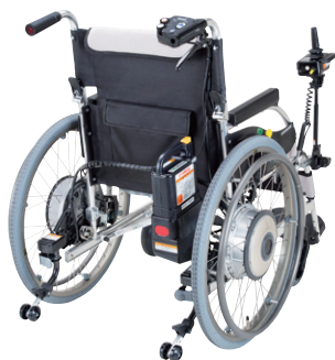
ニッケル水素バッテリー