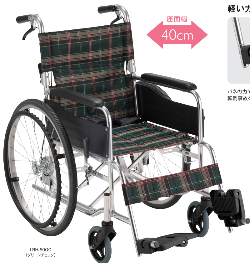
LRH-50GC (グリーンチェック)

ラク→楽に、rise→立ち上がる、Luck rise→運氣上昇 という意味を込めてかけ合せた名前です