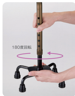
右利き・左利き簡単切り替え