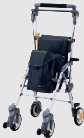
※写真の商品はキャリアスルーンHiとなります。