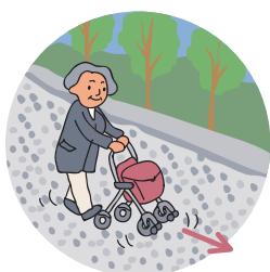
前輪をロックすればまっすぐスムーズ!