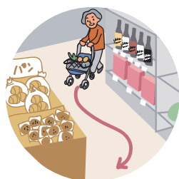
スーパーなどの狭い通路でもラクラク!