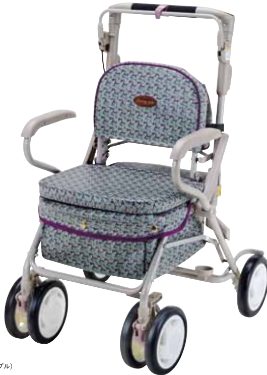
CP-10FP (フラワーパープル)