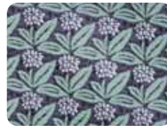
フラワーパープル