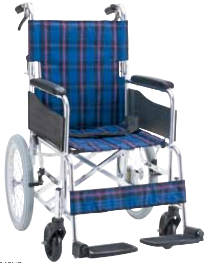
KS30-4043NC (ネイビーチェック)