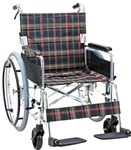
KS50-4643GC (グリーンチェック)