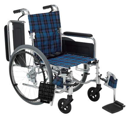
KS80-4043NC (ネイビーチェック)