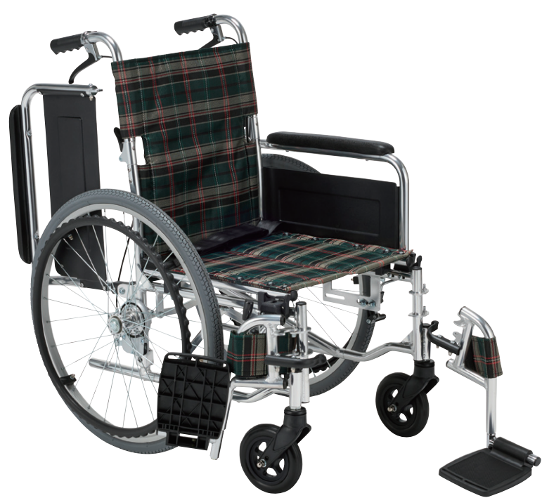
KS80-4043GC (グリーンチェック)