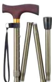
OT-001 つや消しシルバー