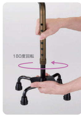
右利き・左利き簡単切り替え