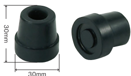
13φ4点杖先 替えゴム ※2個入り