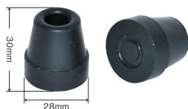
13φ4点杖先 替えゴム ※2個入り