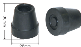
15φ4点杖先 替えゴム ※2個入り