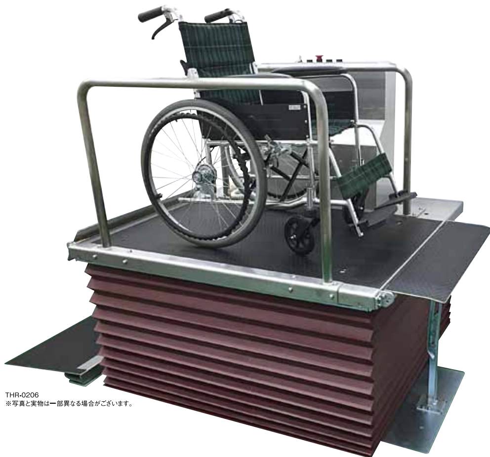
THR-0206 ※写真と実物は一部異なる場合がございます。