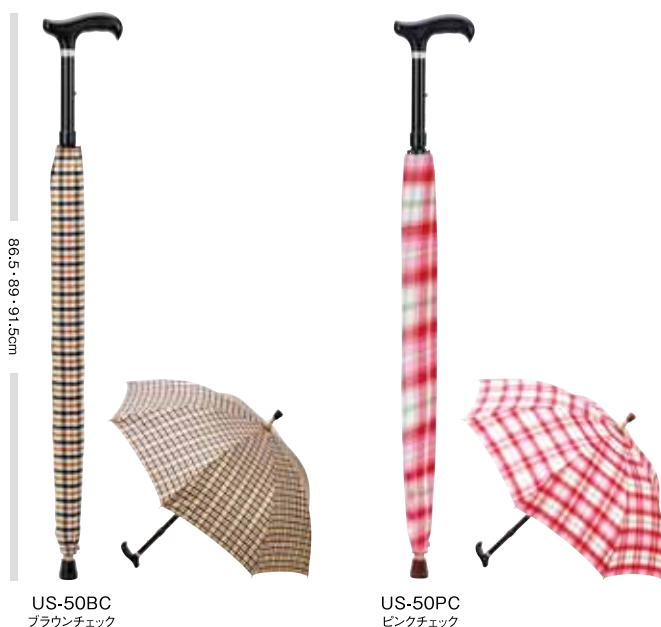
US-50BC ブラウンチェック