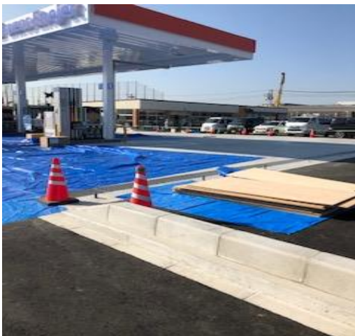
ガソリンスタンド側溝工事

事業所紹介と致しまして、今期、開設より3年目を迎えました。販売強化として、グレーチングと駐輪機の専門事業部とし営業活動しております。グレーチング商材は建築・土木に使用され継続的販売できる商材です。仕上げは溶融亜鉛めっきが主流ですが、海洋・海浜など塩害の厳しい環境・施設では別の仕上げにアルミニウム100%ドブ付けもあります。