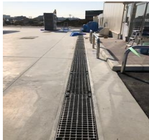
側溝グレーチング工事

大阪市内では、まだまだ自転車駐車場施設が不足しております。弊社は、駐輪メーカーとして多種多様なラインナップを準備しています。適正な用途に提案して参ります。最近では3人乗り電動自転車も多くなり、対応として40kg耐えられるラックの割付提案しております。環境に応じた機能性・耐久性を追求して、既存駐輪ラックの修繕工事・保守点検・新設・改修工事を行い、地域密着型営業にてマキ商品を広めて参ります。