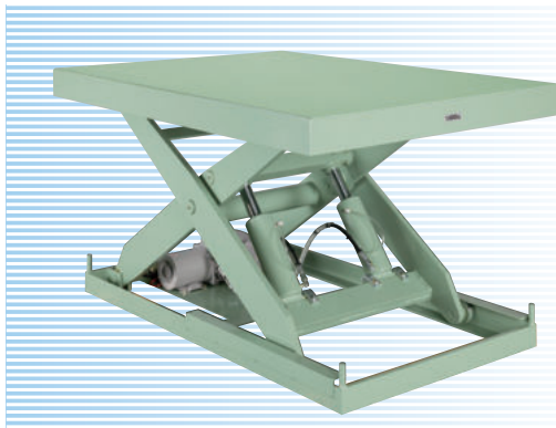
写真はイメージです。