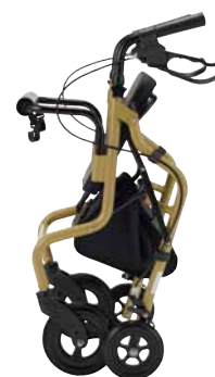
折りたたみ時 (自立します)