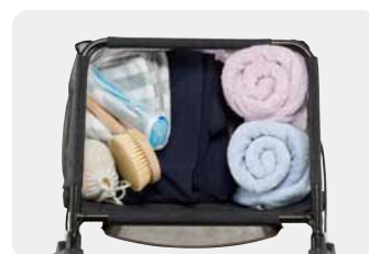
袋イメージ メッシュタイプの袋なので通気性が良く洗濯物や洗面道具を入れる事にも適しています。