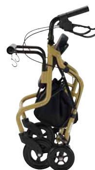
折りたたみ時 (自立します)