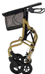
折りたたみ時 (自立します)