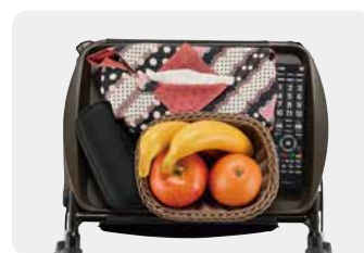
トレイイメージ ※トレイはオプションとなります。 モノを運んで移動しづらい方に便利です。