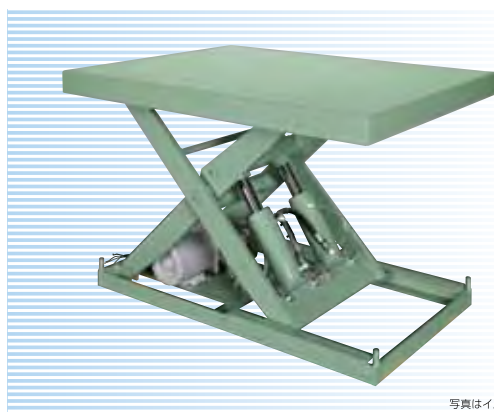
写真はイメージです。