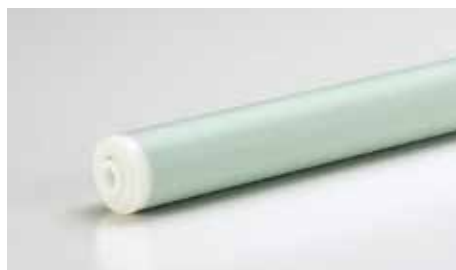
●ミルキーグリーン