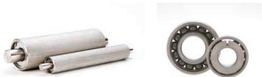
※軸付はオプションです。

ステンレスとセラミック玉の組み合わせにより完成した超高温耐熱ベアリングを組み込んだローラシリーズです。