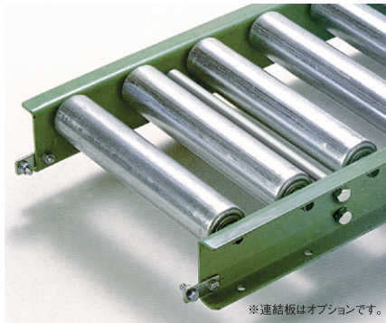
※連結板はオプションです。