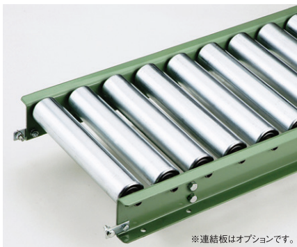
※連結板はオプションです。