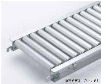
※連結板はオプションです。