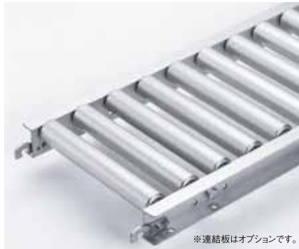
※連結板はオプションです。